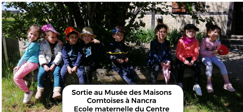
Sortie au Musée des Maisons Comtoises à Nancre Ecole maternelle du Centre