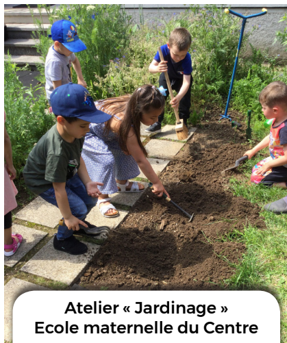
Atelier « Jardinage » Ecole maternelle du Centre

Les initiatives se multiplient pour la jeunesse, les écoles toujours plus investies proposent de nombreuses activités pour les enfants. Retour en image sur les actions menées par les écoles l'année dernière.