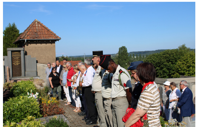
Cérémonie de commémoration - 16 juillet 2019

Sochaliens, élus et officiels se sont retrouvés au carré militaire du cimetière de Sochaux pour honorer la mémoire des 125 victimes civiles du bombardement de Sochaux du 16 juillet 1943.