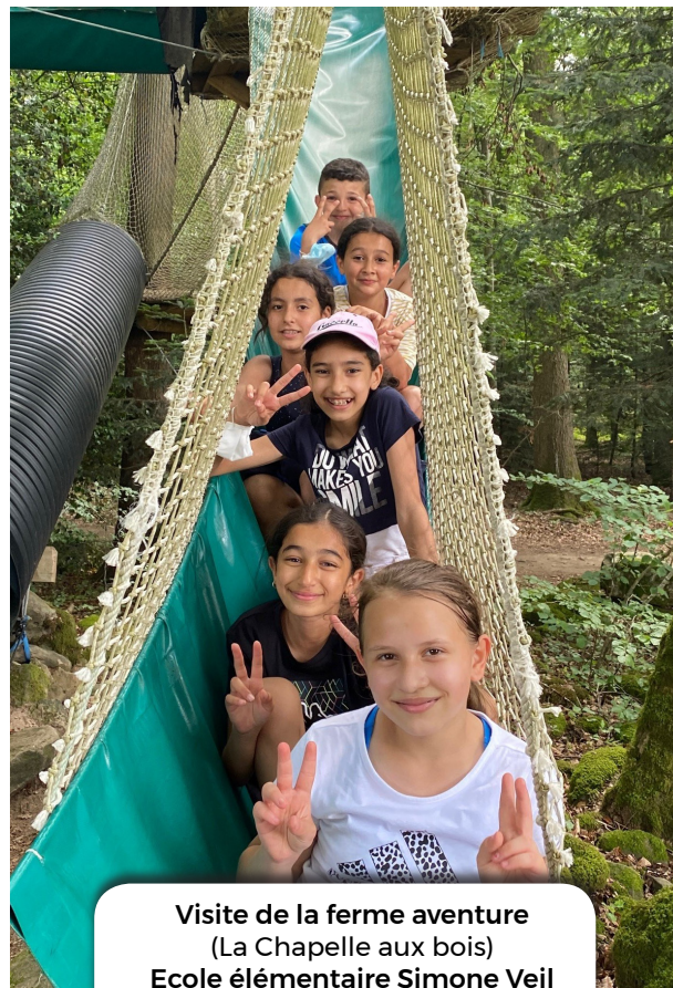
Visite de la ferme aventure (La Chapelle aux bois) Ecole élémentaire Simone Veil