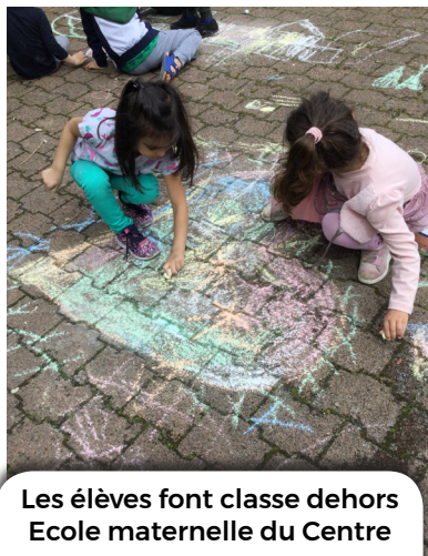
Les élèves font classe dehors Ecole maternelle du Centre