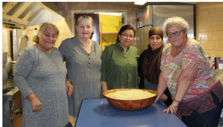
Le couscous du Conseil Citoyen - Une action solidaire qui rassemble